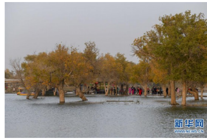
醉美新疆金秋胡杨