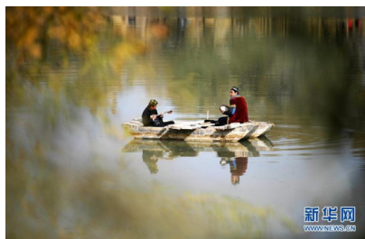
新疆：刀郎部落 秋景...