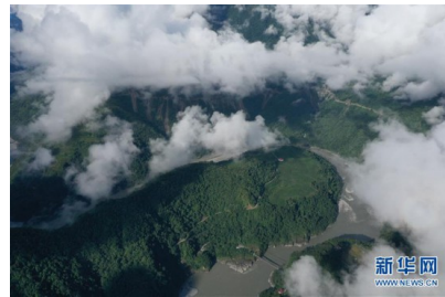
西藏墨脱：“莲花秘境”