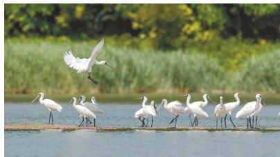
越冬黑脸琵鹭现身深圳...