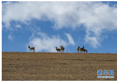
西藏日喀则：美丽的佩...