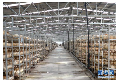
川藏公路上的扶贫“珍”