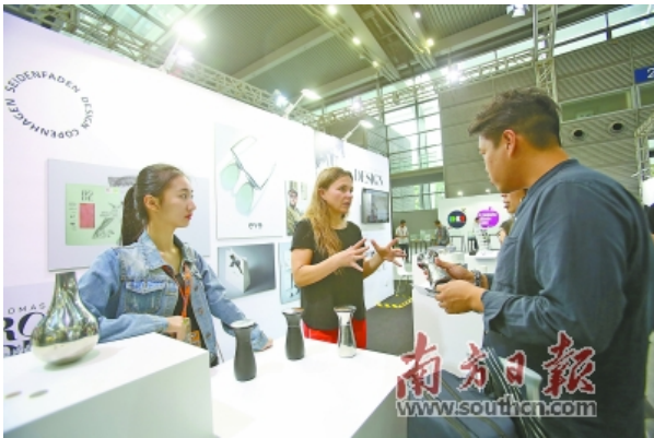
第五届深圳国际工业设计大展现场，外籍参展商正在向观众介绍产品。

作为中国乃至国际工业设计领域的风向标，大展吸引了来自全球30个国家和地区的7000余件创新设计精品，也展示了深圳乃至中国工业设计与国际交融的化学反应——诸多“你中有我，我中有你”的国际交流合作成果及年轻一代工业设计师创新、创业的蓬勃势头。